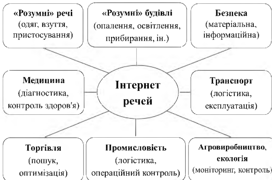
Рис. 2. Сфери використання Інтернету речей

Участь інформаційних факторів у функціонуванні сучасного підприємства пов'язана з виконанням низки функцій, зокрема: