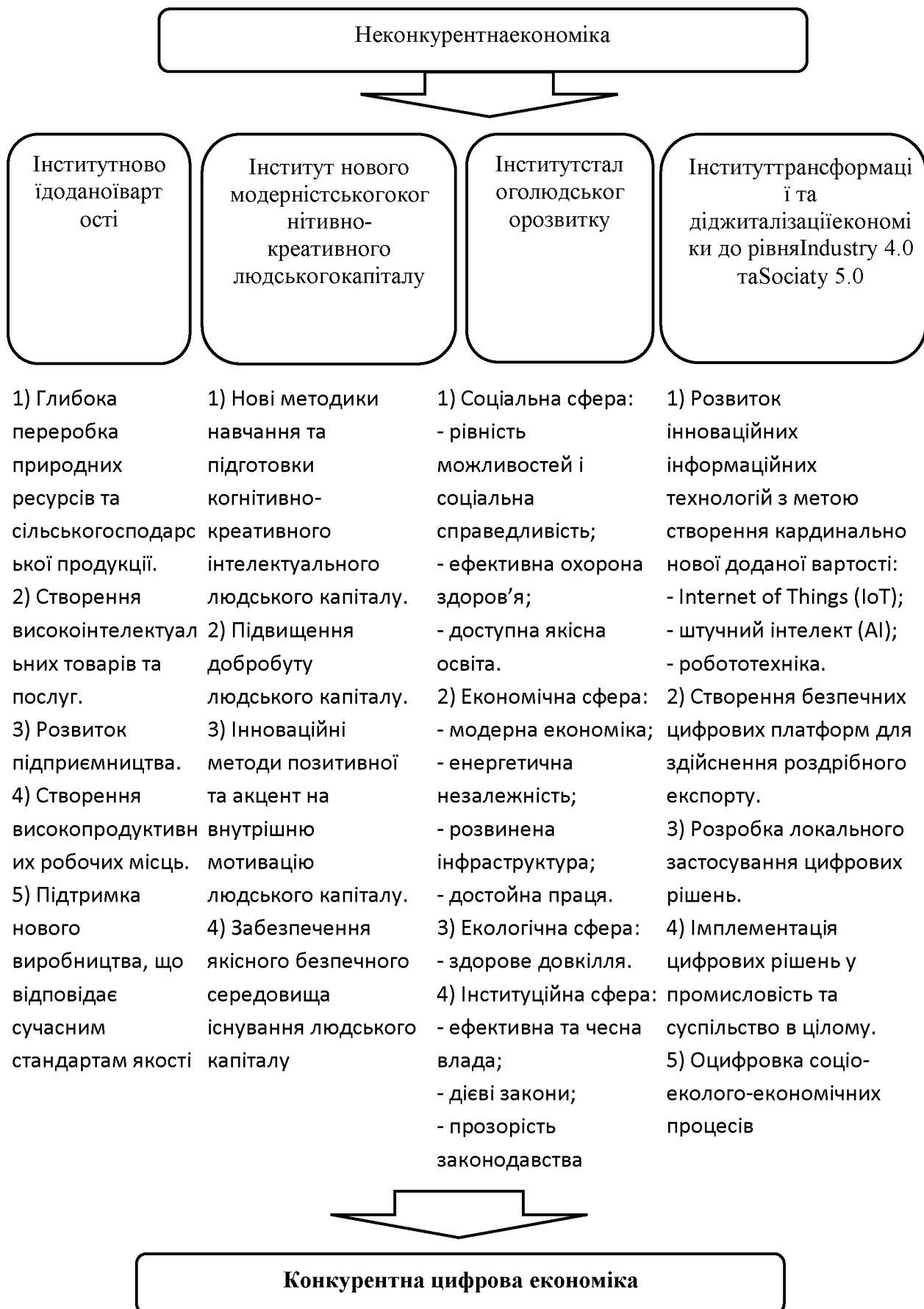
Рис. 3 Модель забезпечення конкурентної цифрової економіки 117